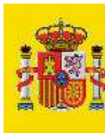
FISCALÍA XERAL DO ESTADO