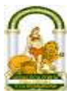
JUNTA DE ANDALUCÍA