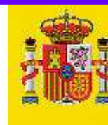
ESTATUKO FISKALTZA OROKORRA