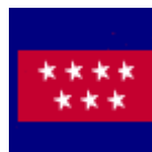
COMUNIDAD DE MADRID