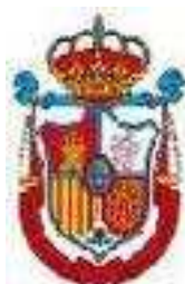
ABOKATUTZAKO KONTSEILU OROKORRA