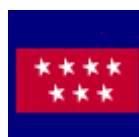
COMUNIDAD DE MADRID