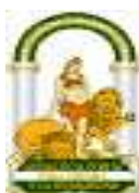
JUNTA DE ANDALUCÍA