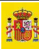
FISCALIA GENERAL DE L'ESTAT